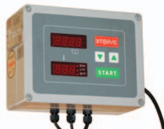
■ Sottoriva MDM (Панель управления)