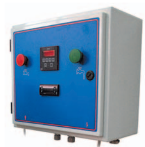
■ Pavailler дозатор – смеситель

Обязательно предусматривать вывод канализации под каждым дозатором и дозатором-смесителем (труба с сифоном на высоту 1 м по стене)