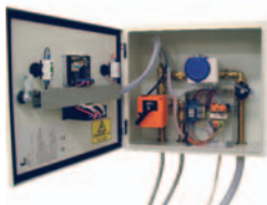
■ Pavailler (внутреннее расположение)

Расположение блока рабочих узлов (смеситель, счетчик и т. д.)